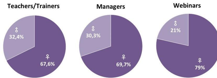
Фигура 3: Пол